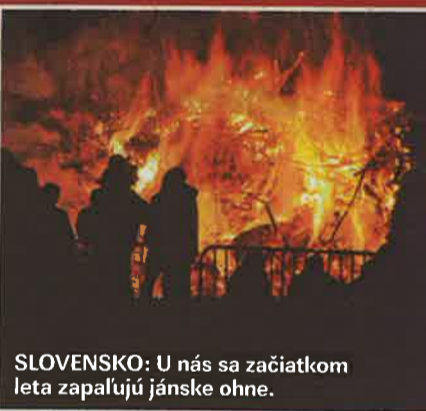
SLOVENSKO: U nás sa začiatkom leta zapalujú jánske ohne.