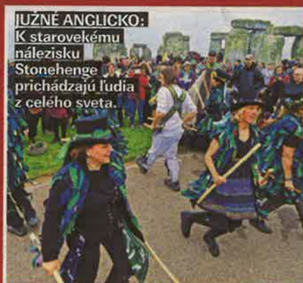
IUŽNÉ ANGLICKO: K starovekému nálezisku Stonehenge prichádzajú ľudia z celého sveta.