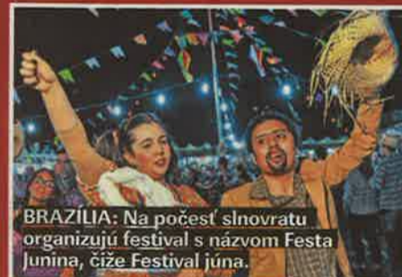
BRAZILIA: Na počesť slnovratu organizujú festival s názvom Festa Junina, čiže Festival júna.