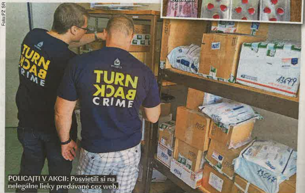
POLICAJTI V AKCII: Posvietili si na nelegálne lieky predávané cez web.

ZAISTENÉ: Tieto tabletky na erekciu muži zákona zhabali.